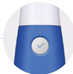
Nút bắt đầu quét