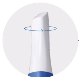
Đầu Tip đảo ngược 180°