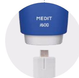
Cáp có thể tháo rời